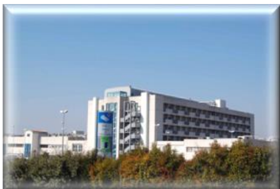
OSPEDALE ALTO TEVERE