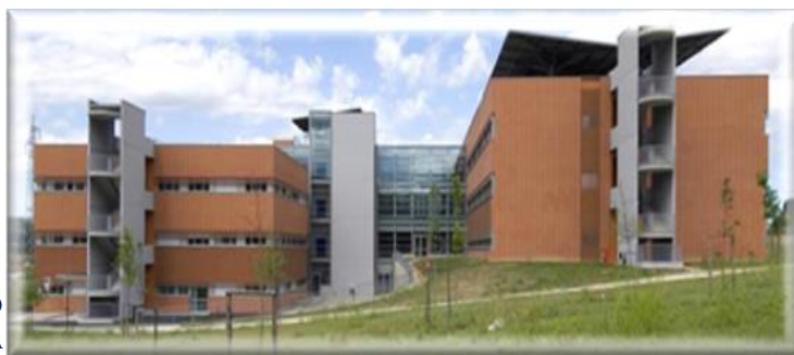
OSPEDALE DI GUBBIO GUALDO TADINO LOCALITÀ BRANCA