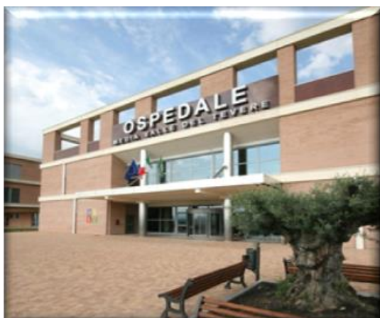
OSPEDALE MEDIA VALLE DEL TEVERE LOCALITÀ PANTALLA