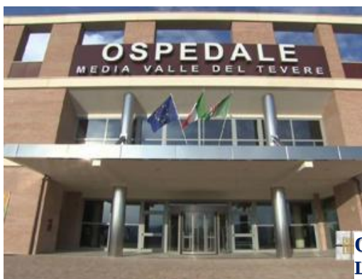
OSPEDALE MEDIA VALLE DEL TEVERE LOCALITÀ PANTALLA