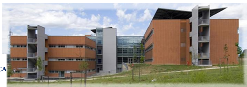
OSPEDALE DI GUBBIO GUALDO TADINO LOCALITÀ BRANCA