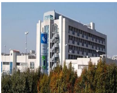
OSPEDALE DI CITTÀ DI CASTELLO